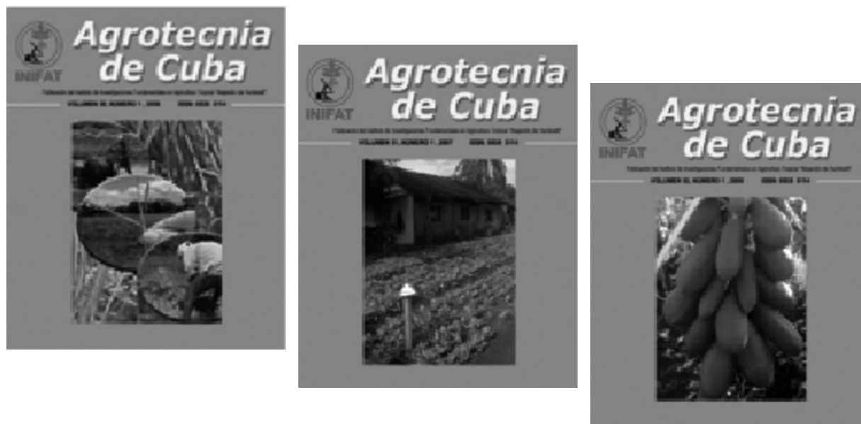
Figura 2. Portadas de la revista Agrotecnia de Cuba (2006, 2007, 2008) en formato digital disponible en www.actaf.co.cu

Guiada por las nacientes tendencias de desarrollo de los World Wide Web (WWW) y el HTML y un incremento notable de la difusión del conocimiento, Agrotecnia de Cuba comienza a editarse también en formato electrónico, en el 2005. Esta variante no sólo dio continuidad a la revista sino que permitió introducir transformaciones retomando elementos propios de la publicación impresa como presentación, estructura, organización de la información y aumento en la producción de artículos con una publicación casi instantánea.